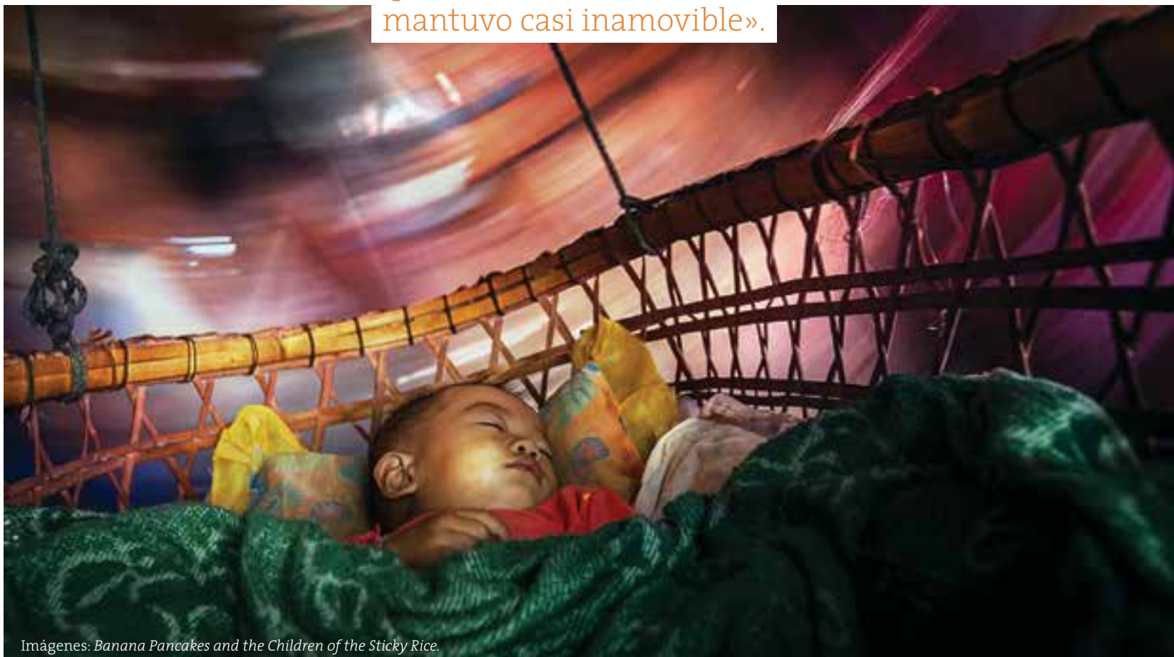
Imágenes: Banana Pancakes and the Children of the Sticky Rice .

«Cara a cara la modernidad de unos se enfrentó con la autenticidad de otros trastocando un estado de cosas que durante milenios se mantuvo casi inamovible».