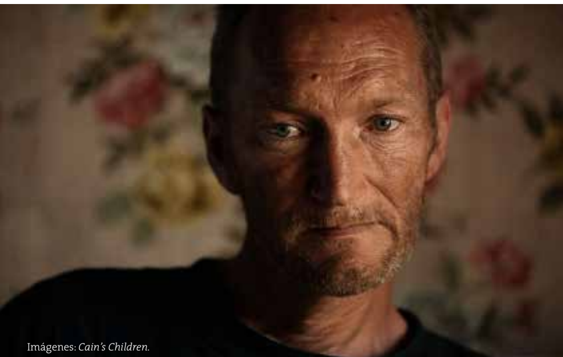
Imágenes: Cain's Children .

La cinta, ambientada en Hungría, repasa lo sucedido con tres jóvenes —menores de edad— que asesinaron en los inhóspitos años del comunismo. Intercalando material de archivo (de los juicios, del reformatorio,