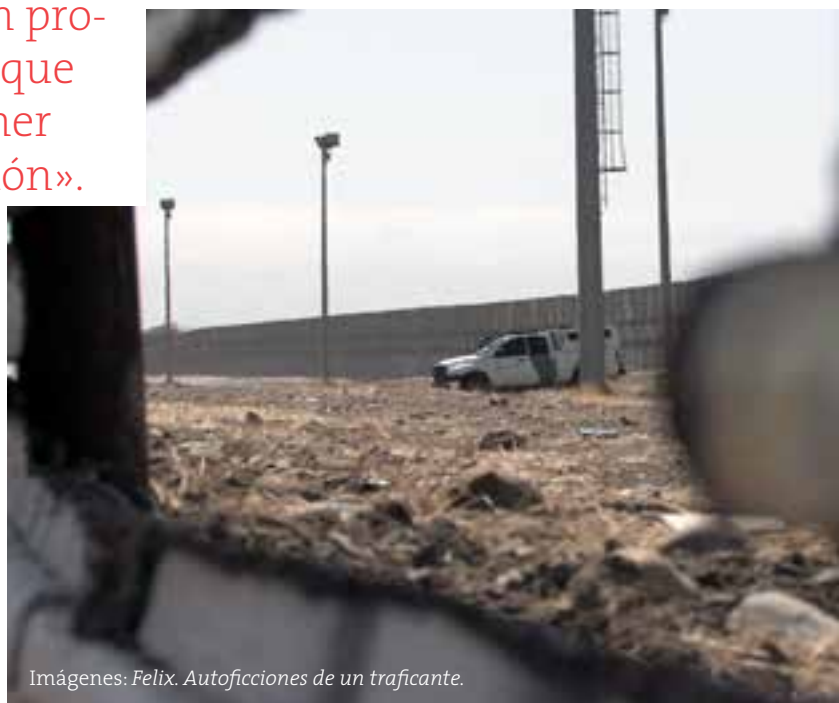
Imágenes: Félix. Autoficciones de un traficante .