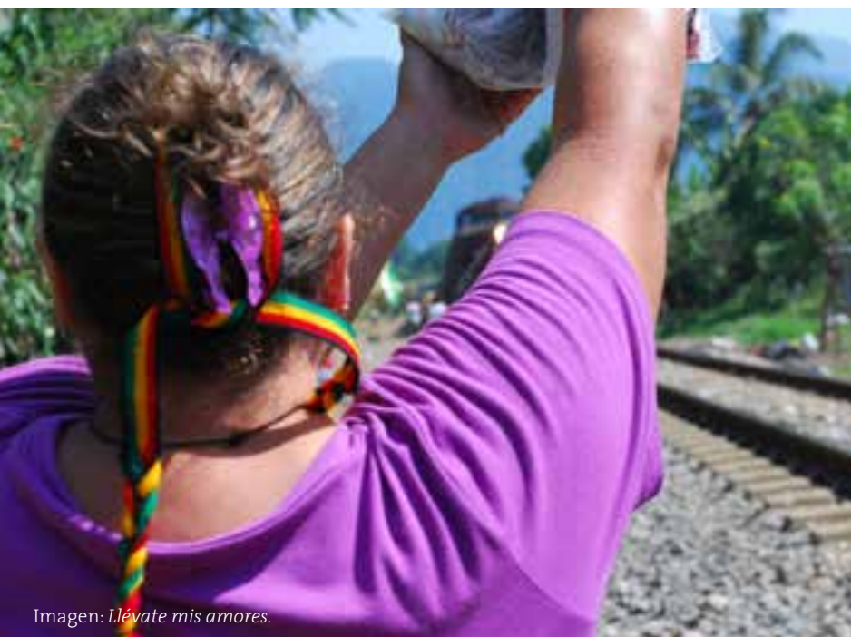
Imagen: Llévate mis amores .