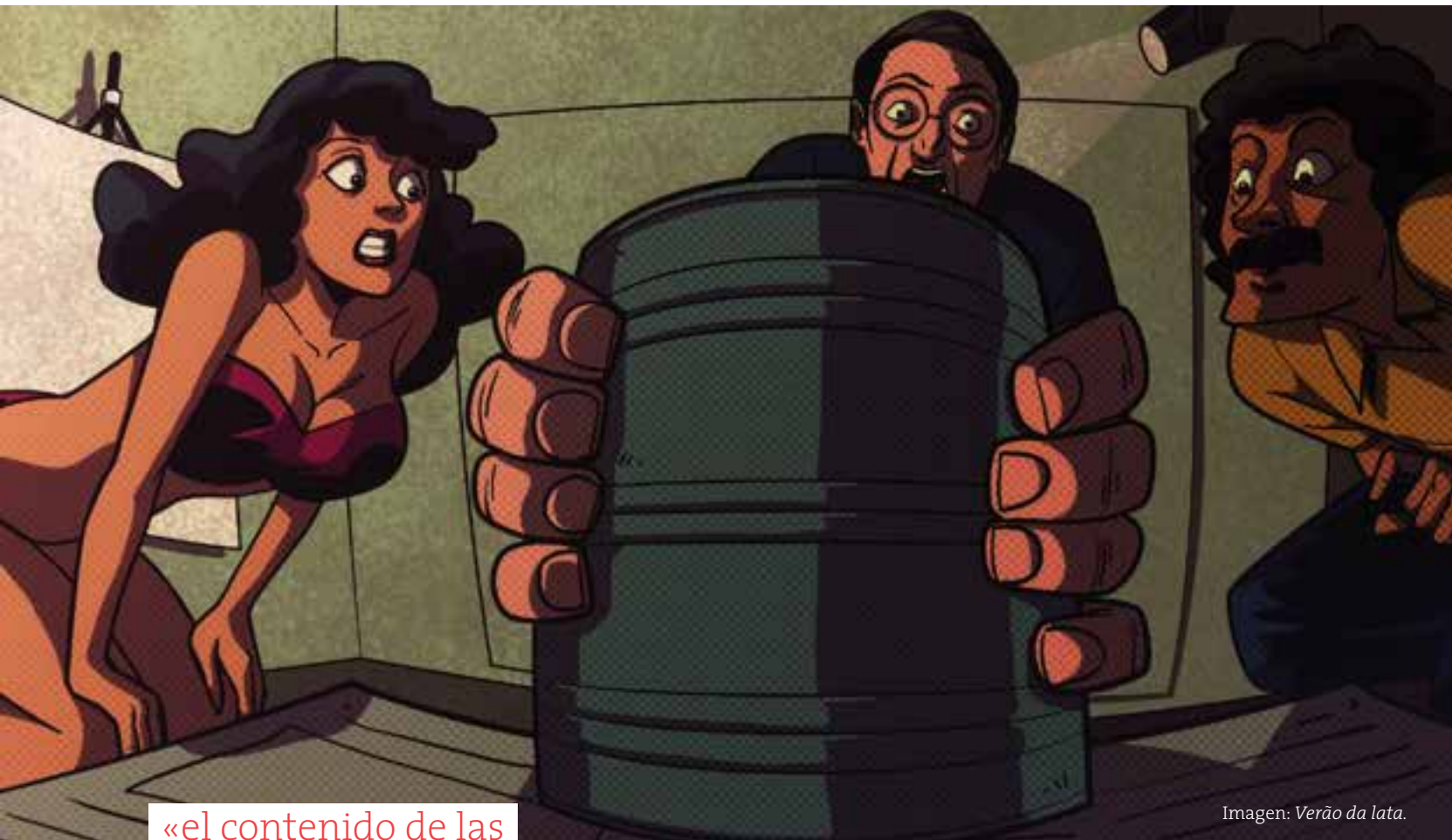
Imagen: Verão da lata .

«el contenido de las latas provocó que los pescadores vieran animales desconocidos para ellos».