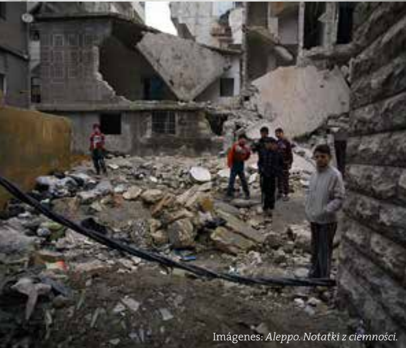
Imágenes: Aleppo. Notatki z ciemności .