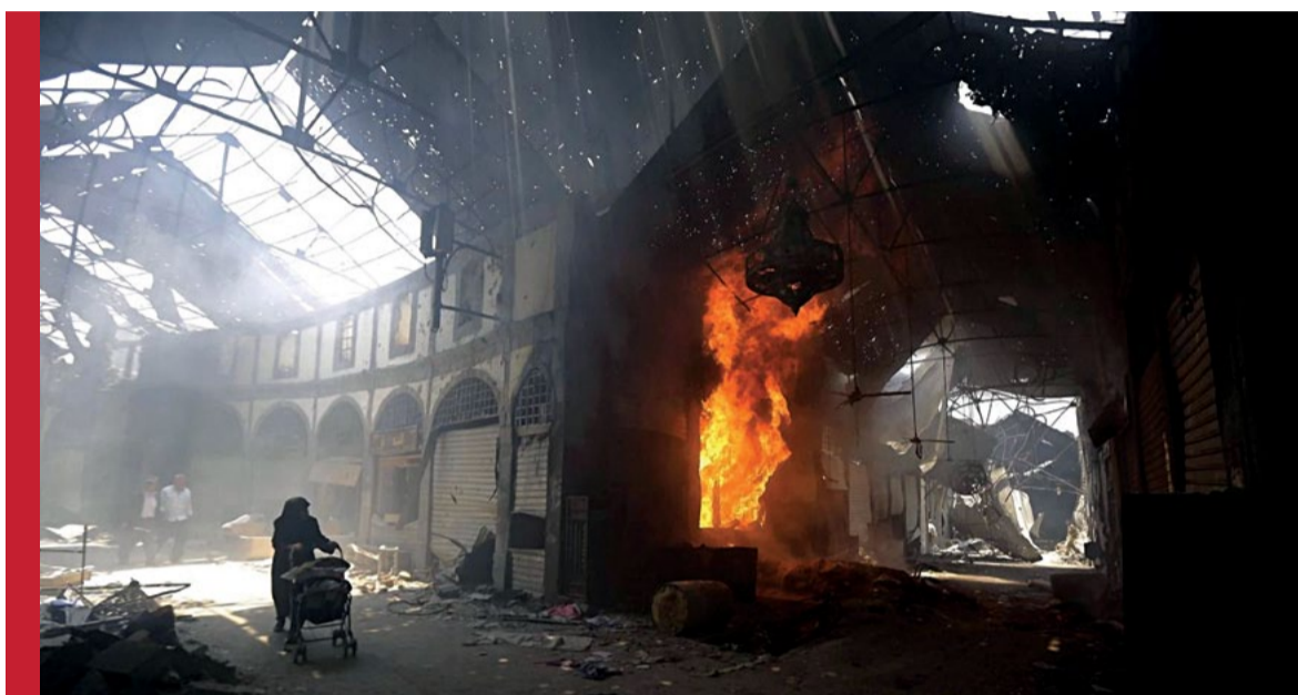
Return to Homs | Talal Derki | Siria, Alemania | 2013

Return to Homs no es una crónica del conflicto sino de sus protagonistas, un retrato de hombres que sufren y ríen, que matan y lloran. Talal Derki utiliza la cámara como un arma y dispara imágenes que duelen como balazos. Para mostrar el terrible sufrimiento de un pueblo abandonado a su suerte. Para denunciar el patético papel de la onu. Para reclamar