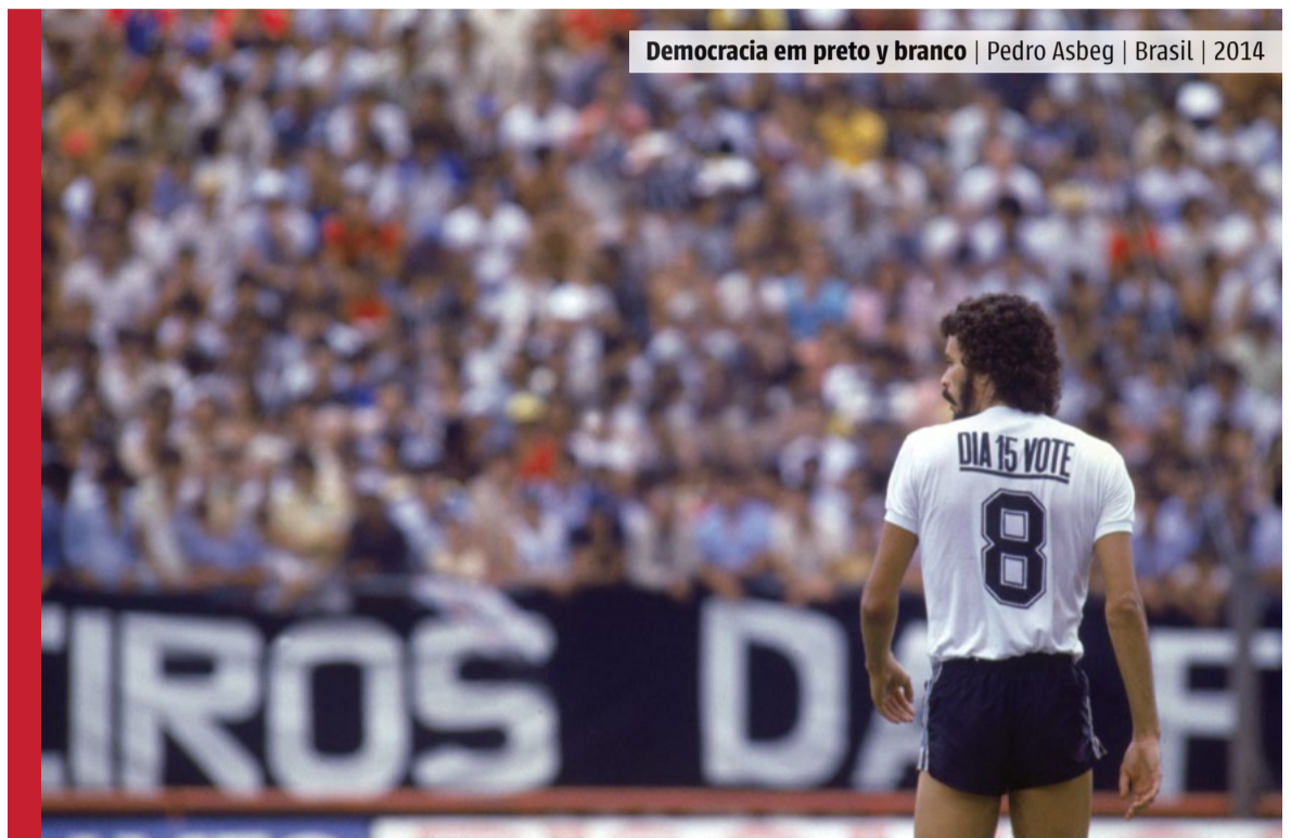
Democracia em preto y branco | Pedro Asbeg | Brasil | 2014

Implanta el gran Sócrates la democracia corinthiana