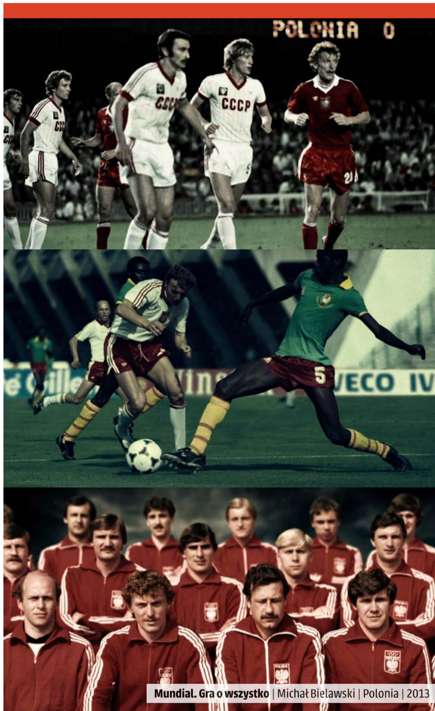
Mundial. Gra o wszystko | Michał Bielawski | Polonia | 2013