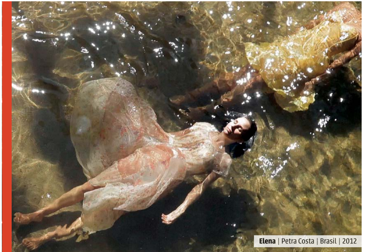
Elena | Petra Costa | Brasil | 2012

Tres mujeres vinculadas para siempre, una madre y sus hijas, enfrentando su propia soledad y sufrimiento. Y del mismo modo, tres espíritus creativos plasmados mediante imágenes oníricas, desesperados por sublimar sus conflictos por medio del ar-