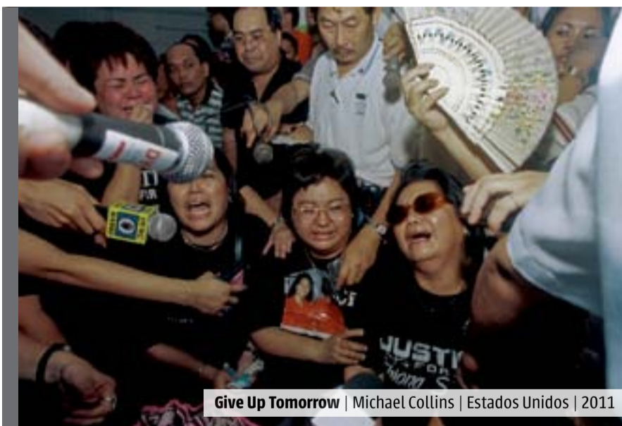
Give Up Tomorrow | Michael Collins | Estados Unidos | 2011