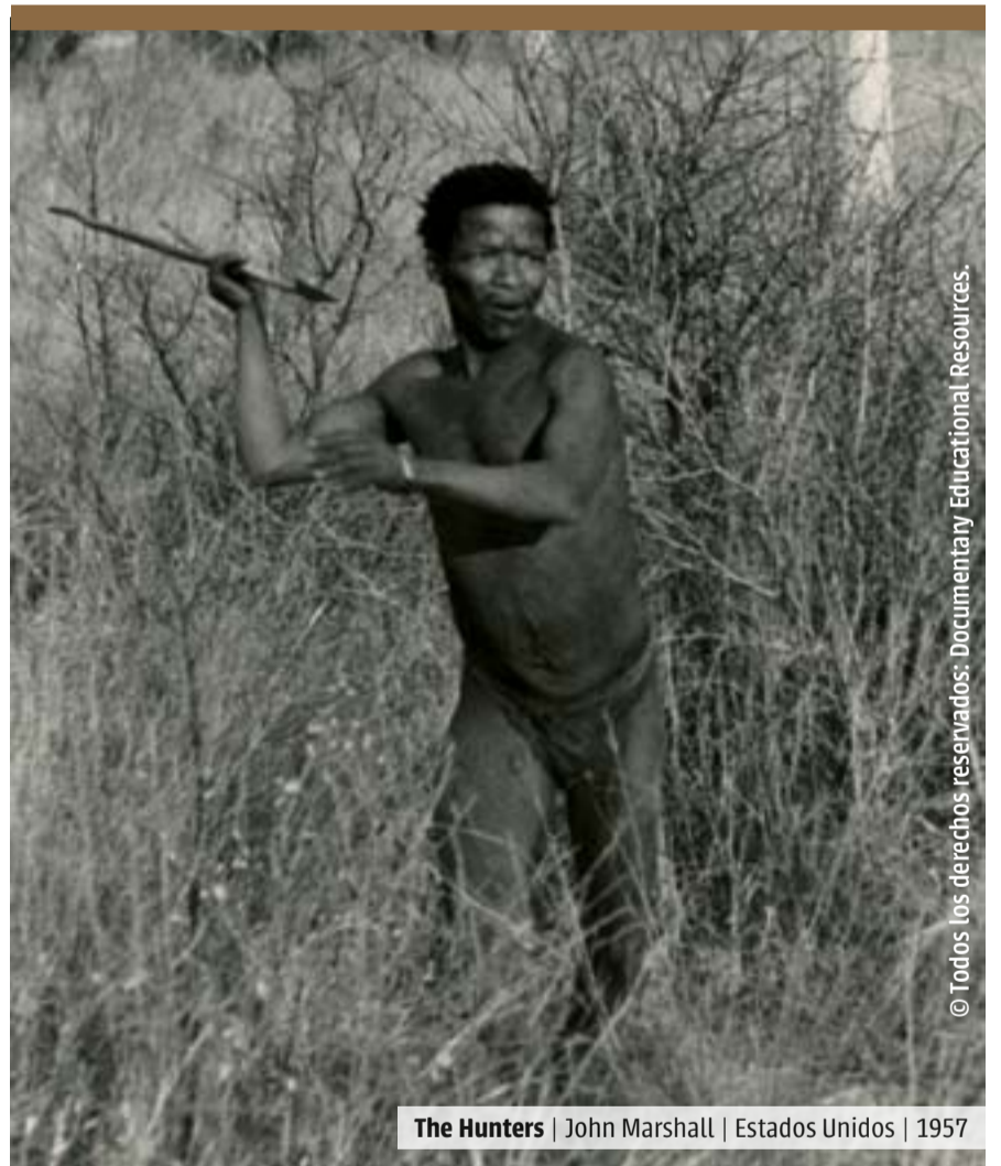
The Hunters | John Marshall | Estados Unidos | 1957

@perlaschwartz es poeta, ensayista y crítica de cine.