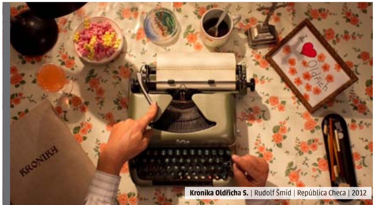
Kronika Oldřicha S. | Rudolf Šmíd | República Checa | 2012

Doctubre es la nueva sección competitiva que llevará la programación de DocsDF a toda la República mexicana y busca formar audiencias más informadas y críticas. Este año, Doctubre tendrá presencia en 145 espacios de exhibición alternativos en 64 poblaciones de las 32 entidades federativas.