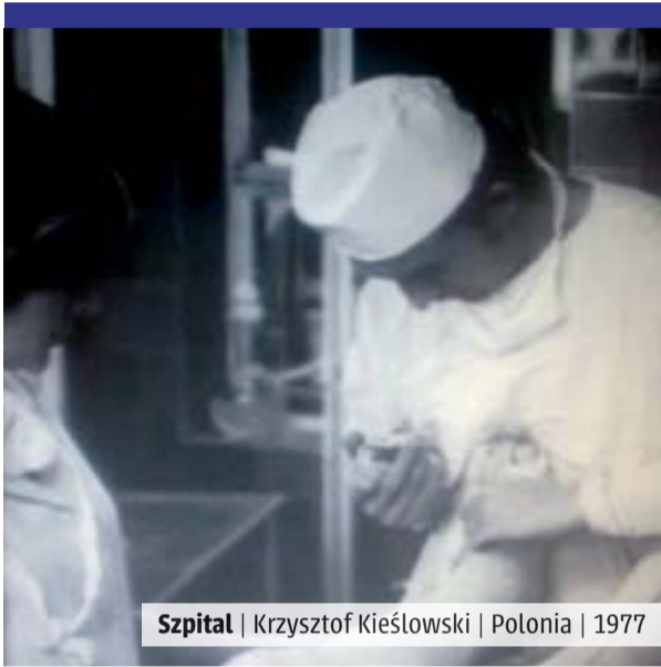
Szpital | Krzysztof Kieślowski | Polonia | 1977

Desnuda Kieślowski al sistema polaco de salud pública